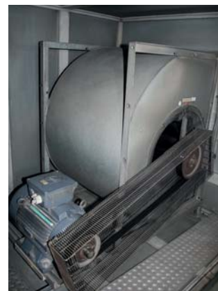
Abb. 1) zu tausender Ventilator

Das Bundesamt für Wirtschaft und Ausfuhrkontrolle (BAFA) gewährt Investitionszuschüsse zum Einsatz hocheffizienter Querschnittstechnologien für Ventilatoren in RLT-Anlagen. Die Förderung erfolgt dabei in Form einer Anteilsfinanzierung und wird als nicht rückzahlbarer Zuschuss in Höhe von bis zu 30.000 € gewährt. Gerne beraten und unterstützen wir Sie bei der Beantragung Ihrer Fördermaßnahme.