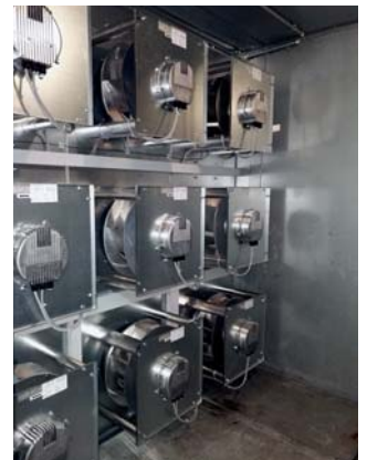
Abb. 11) Druckseite der ECFanGrid