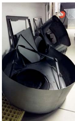
Abb. 8) Ausbau des alten Ventilators