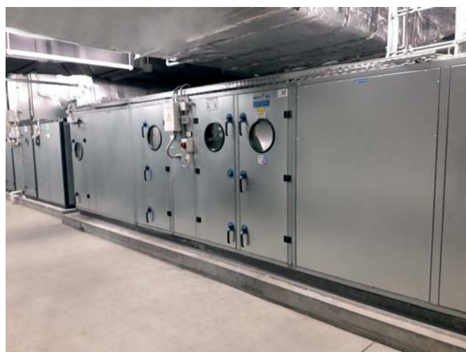
Abb. 7) Umzubauendes Klimagerät