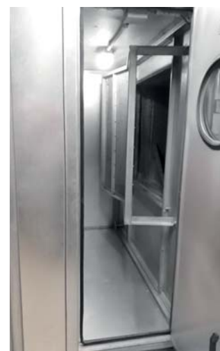
Abb. 9) Prallplatte im bestehenden Klimagerät