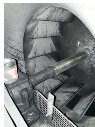
Abb. 3) Verschmutzung