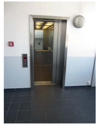
Abb. 5) Ausreichender Zugang für eine ECFanGrid

Soll ein alter Ventilator gegen einen großen riemen- oder direktgetriebenen Ventilator getauscht werden, ergeben sich häufig nahezu unüberwindbare Hürden. Das Gebäude ist nicht selten im Laufe der Zeit weiter gewachsen, sodass der Zugang zu den Technikzentralen erschwert ist. Wenn sich die Zentrale auf dem Dach befindet, muss der neue Ventilator mit einem Kran eingebracht werden, was zusätzliche Kosten bedeutet. Bei gemauerten Kanälen kann es erforderlich sein diesen komplett einzureißen und anschließend wieder neu zu mauern. Aus diesen Gründen war eines unserer Hauptaugenmerke bei der Entwicklung des ECFanGrid Systems die einfache Einbringung. Sie können ohne Probleme vorhandene Treppen und Aufzüge nutzen und passen mit dem Material durch jede Türe. Der gesamte Umbau lässt sich mit zwei Personen bewältigen. Künftige Tausche können innerhalb weniger Minuten getätigt werden.