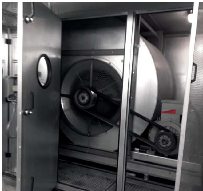
Abb. 6) Bestandsventilator

Da mehrere baugleiche Anlagen umgerüstet werden sollten, entschied sich der Kunde bei der ersten Anlage für eine Messung. Die Gegenüberstellung zwischen b) und c) deckt weiteres Einsparpotential auf, welches der Neuauslegung zugute kommt. Während das alleinige Heranziehen der nicht gewichteten Gerätekarte die schlechtesten Voraussetzungen für einen Umbau liefert.