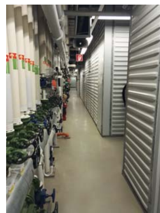
Abb. 4) Beengter Technikraum