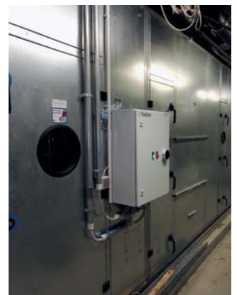
Abb. 12) Schaltschrank der ECFanGrid

Montageanleitung Detaillierte und bebilderte Anleitung zum Aufbau des ECFanGrid Retrofit Systems