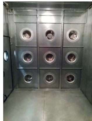
Abb. 10) Saugseite der ECFanGrid

Das Gehäuse des riemengetriebenen Radialventilators muss im Klimagerät mit einem Winkelschleifer zerlegt werden, vergleiche Abbildung 8. Anschließend wird die mechanische Wand nach der beiliegenden Montageanleitung luftdicht eingebaut. Jene finden Sie entweder beiliegend im Anhang oder zum Download, siehe unten. Alle Teile sind in dem Kit enthalten. Als nächstes wird ein Ventilator nach dem anderen von oben nach unten in die Wand eingesetzt. An der Gehäuseaußenseite wird der Schaltschrank mittels Einnietmuttern befestigt. Mit den beiliegenden Leitungen, Kabelkanälen und Paneeldurchführungen wird nun jeder Ventilator in den Schaltschrank verdrahtet. Um den Volumenstrom erfassen zu können wird der mitgelieferte Volumenstromsensor an die Ringmessleitung der Ventilatoren angeschlossen. Nun kann die Anlage in Betrieb genommen werden. In Abbildung 10, 11 und 12 ist die umgebaute ECFanGrid Anlage abgebildet.