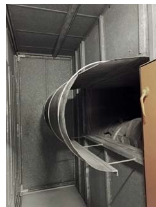
Abb. 2) Prallschirme sind unnötige Druckverluste